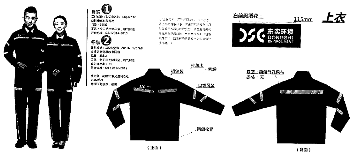
图 1: 工服上衣款式示意图