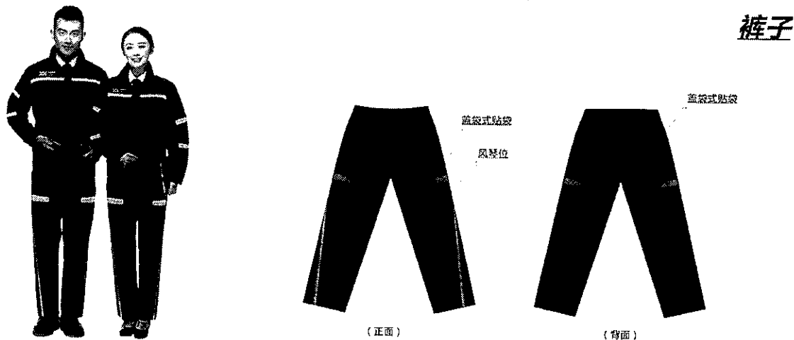
图 2: 工服裤子款式示意图