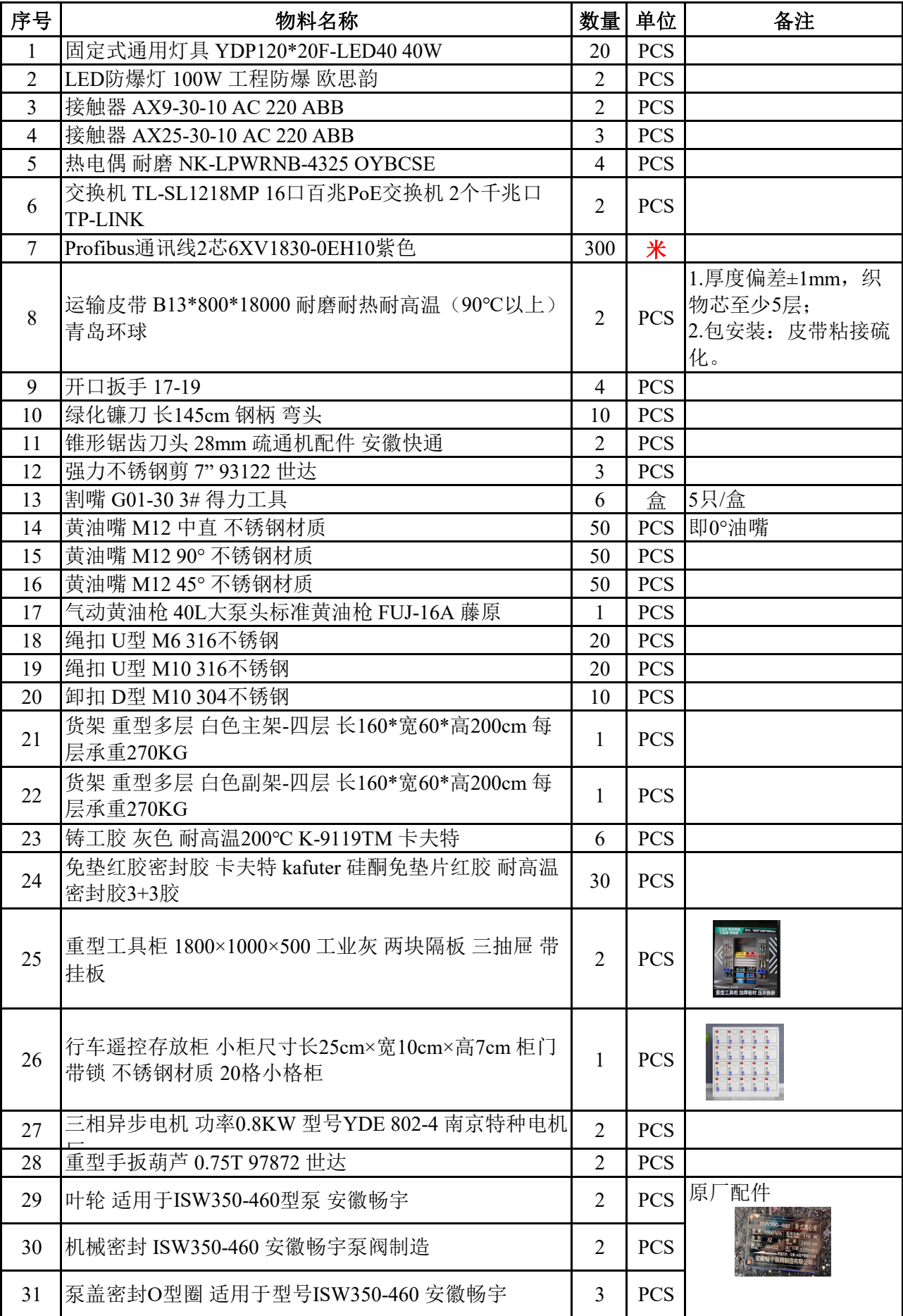
附件《新东欣公司2025年生产物资采购（第6批）项目物资清单》